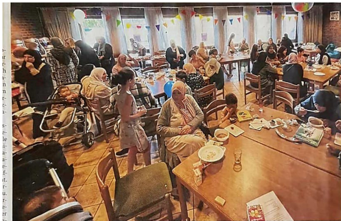
Im Gemeindefest kamen die Menschen zusammen, um gemeinsam die Speisen der jeweils anderen zu probieren.