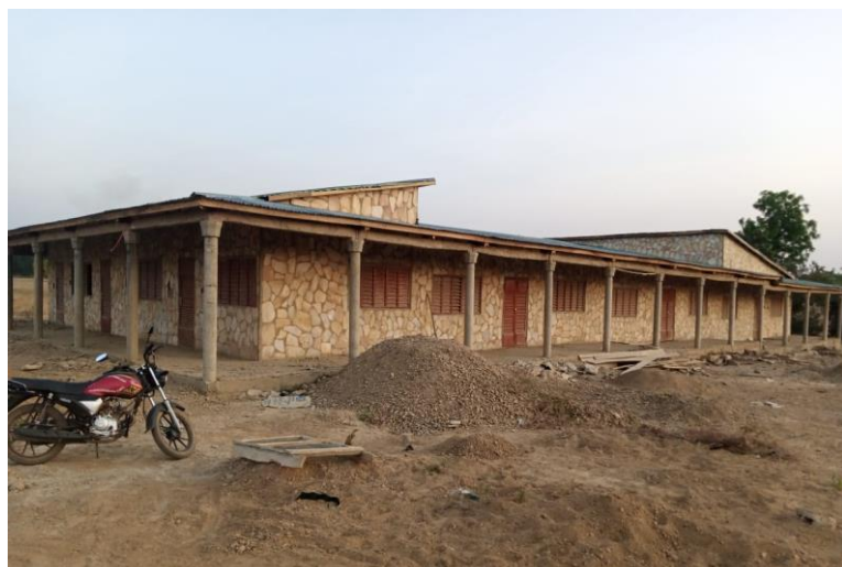
Das Krankenhaus - Seite der Wöchnerinnen

In Boukombé, im Norden Benins, liegt dagegen unser derzeitiger Schwerpunkt im Gesundheitswesen. Wir konnten das Krankenhaus der CERD mit je drei Zimmern für die Allgemeinmedizin und die Wöchnerinnen im Rohbau besichtigen. Jedes Zimmer wird 5 Patienten beherbergen. Ein Wasserturm ist in Betrieb, das Geburtshaus (Kreißsaal), der Technikraum für die Solaranlage, die in Zusammenarbeit mit der GIZ (Gesellschaft für Internationale Zusammenarbeit) errichtet wird, und eine kleine Apotheke sind fertig. Nun fehlen noch die Sanitärräume und die Kochstelle, in der die Angehörigen die Patienten versorgen müssen. Wir freuen uns auf die Inbetriebnahme Ende 2023.